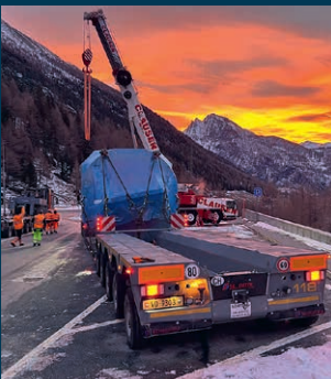
Transport des Generators